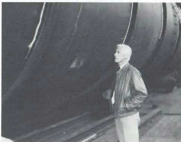
FJ mindes råjernstiden

Størstedelen af tiden har været inden for maskinfabrikken. Da den startede op, var der ikke mange, der troede på, at sådant et foretagende nogensinde kunne stå alene. Folkene i råjernet ville næppe have forestillet sig, at maskinfabrikken ville