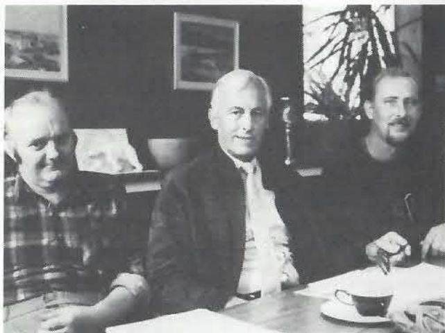
FJ med tillidsmænd på SU-møde

at vi har været helt enige - det ligger i sagens natur. Af og til har det også resulteret i "sure minner" - folk er gået i kantinen - der har også været arbejdsnedlæggelser. Det er ikke rart. Så må man sidde tilbage og tænke, om man nu har gjort ret ved at "stå fast". Men folkene er nu altid vendt tilbage igen. Der må også være forståelse for, at der skal "holdes igen". Det letteste ville jo være at sætte penge-kassen op i værkstedet, så alle selv kunne forsyne sig.