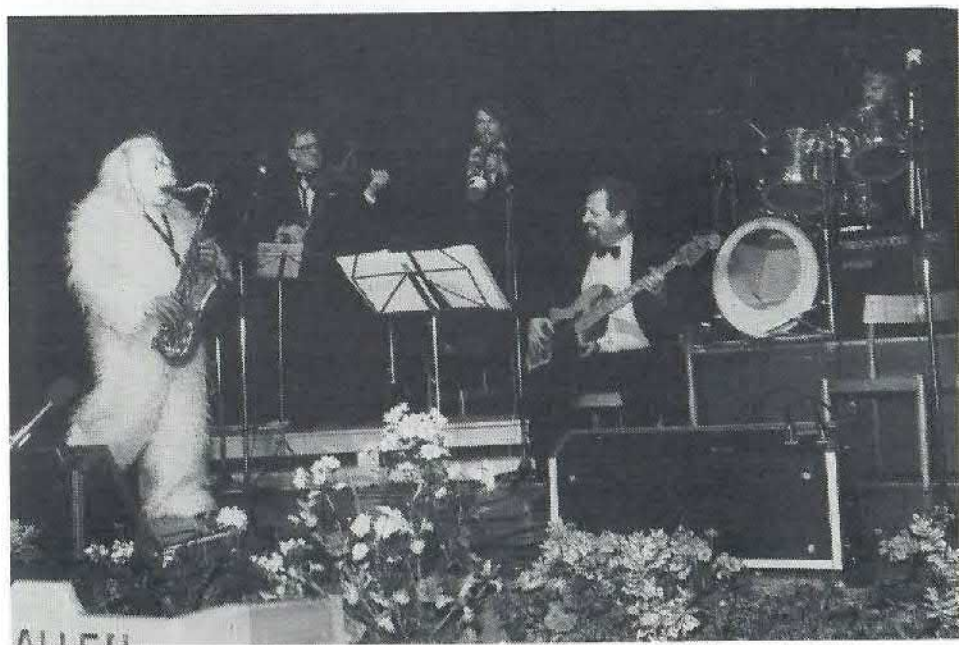
Lejlighedssangen - naturligvis på melodien "Bamses fødselsdag" - blev akkompagneret af musikalsk isbjørn