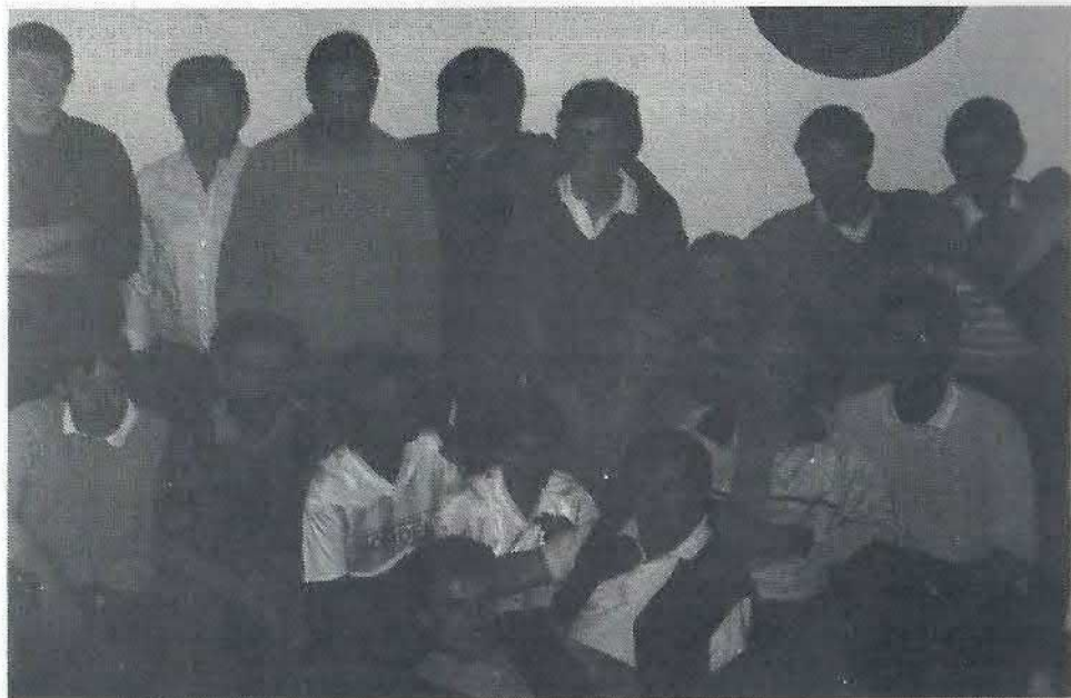
Det fortræffelige Lübeck-team med det utrættelige serveringspersonale