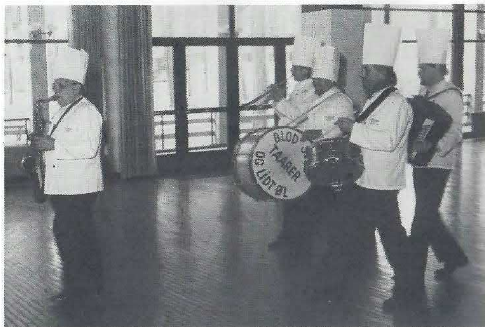
Indmarch til tonerne af "Kokkeorkestret"