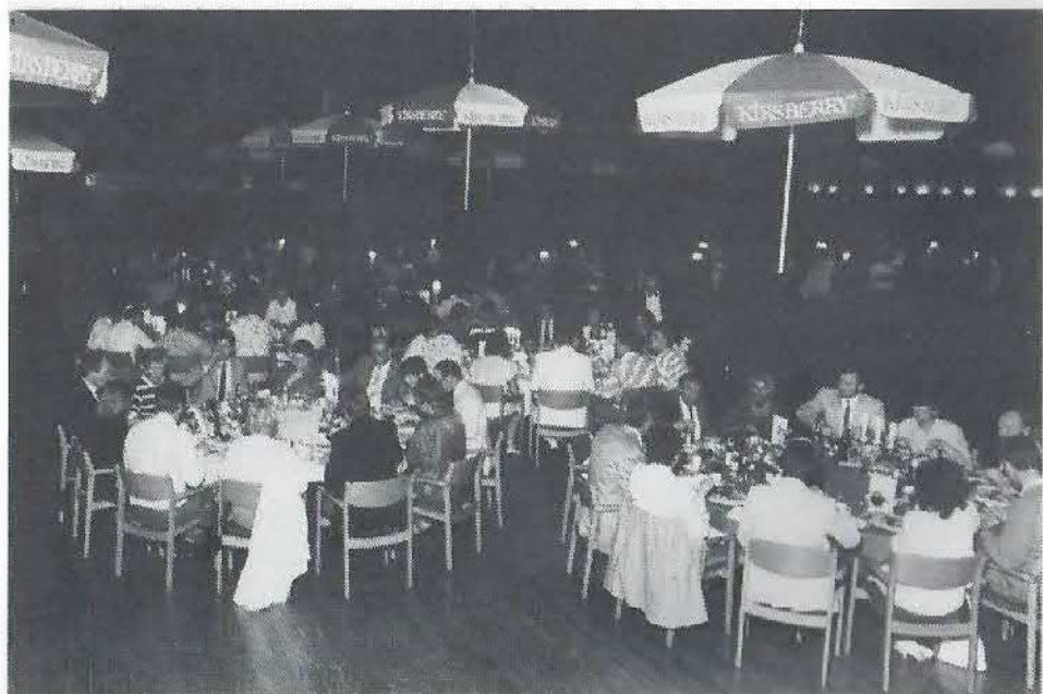
Festmiddag - med kniv og gaffel