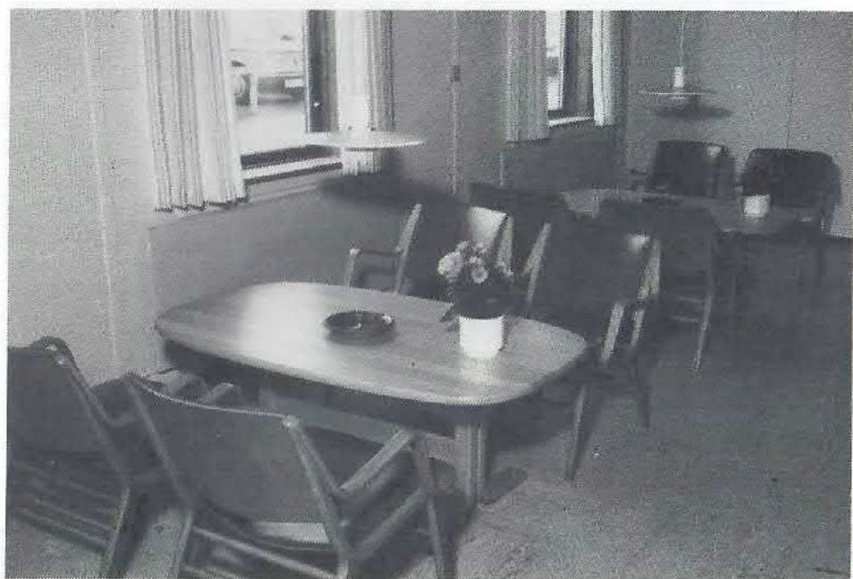
FLS' gave: nye møbler til FLS-stuen