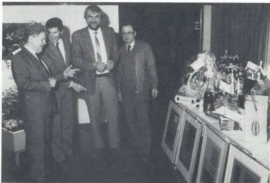
Aalborg Portlands medarbejdere instruerede i ophængning af gaven forestillende morgen, middag, aften og nat