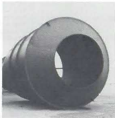
Kalcinatorrør til cyklontårn