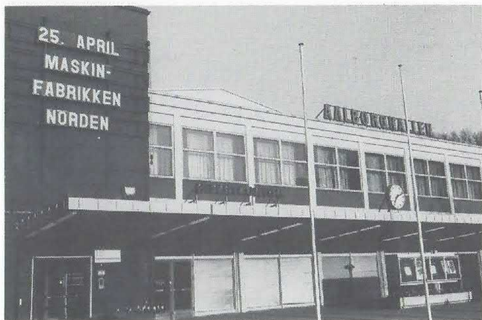
Der var ikke tvivl om, hvor NORDEN-folkene skulle hen