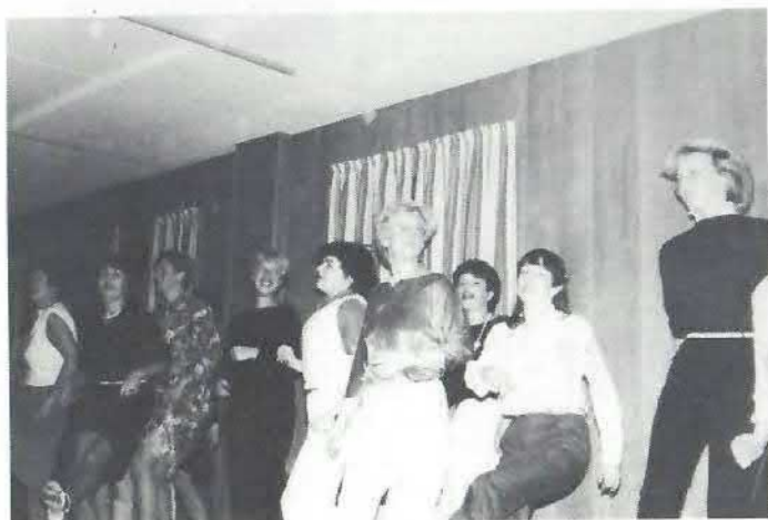
Så du damer.